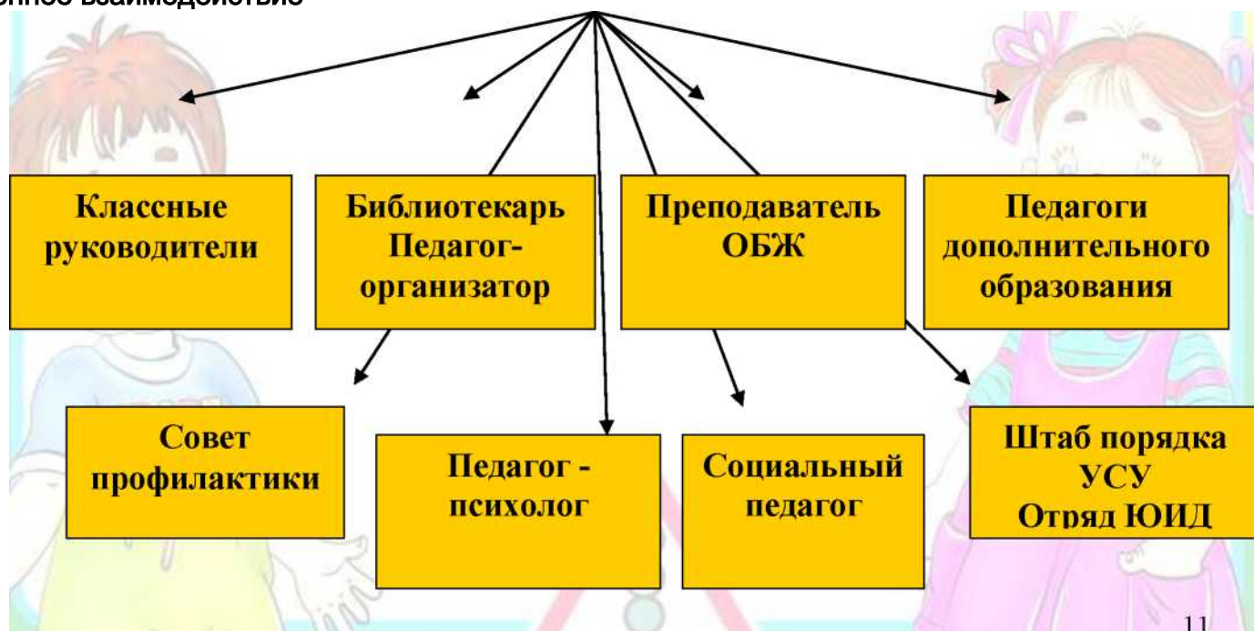
Структура внутренних и внешних взаимодействий по организации профилактики дорожно-транспортных происшествий